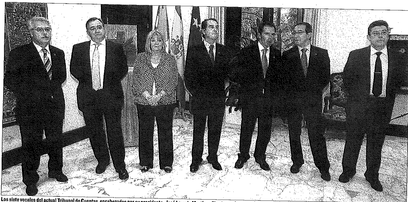
Los siete vocales del actual Tribunal de Cuentas, encabezados por su presidente, José Ignacio Martínez Churruarín (izquierda), tras su designación en el Parlamento en 2009.

RECTIFICACIÓN EL PSE-EE SE DESDICE TRAS SU PACTO CON EL PNV Y EVITA LA REPROBACIÓN DE ANA OREGI (PÁG.2) ECONOMÍA EROSKI BUSCARÁ ALIANZAS EN EL RESTO DE ESPAÑA, PREVÉ CRECER UN 12% Y CREAR EMPLEO (PÁG.7)